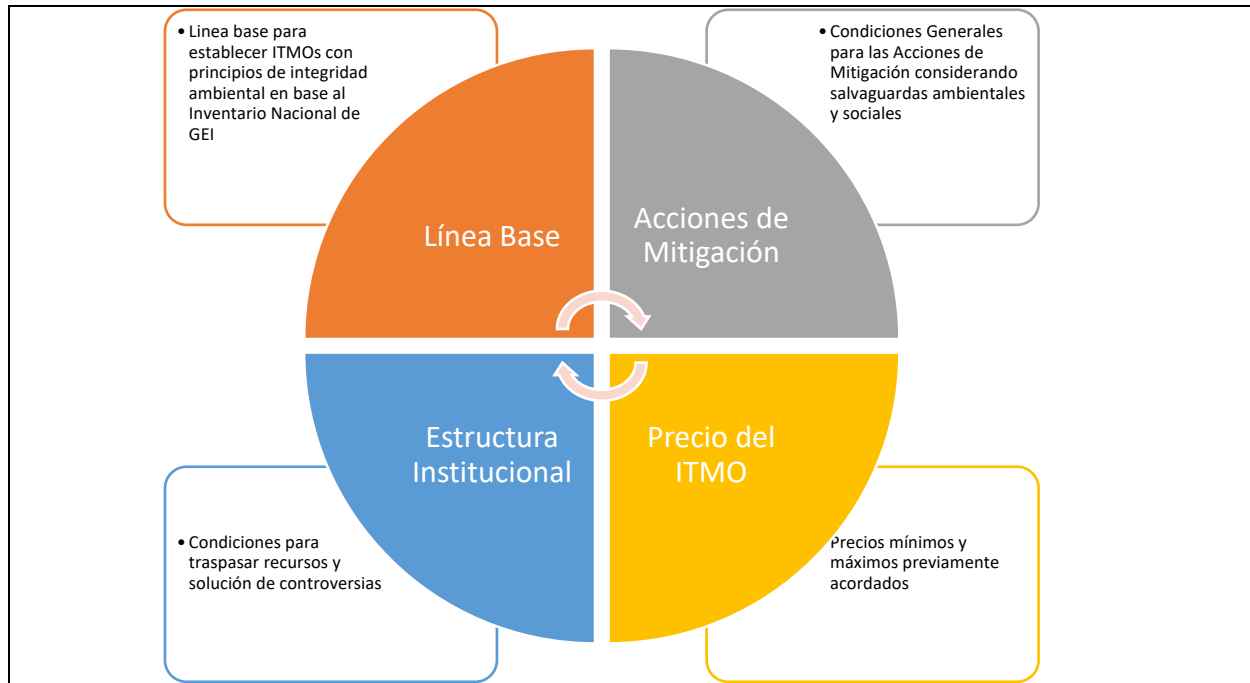
Figura 2 Núcleo Central de un Acuerdo de Climate Action Teams