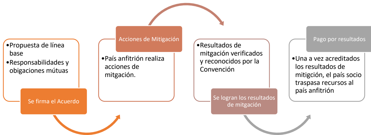
Figura 4 Sistema de Cumplimiento de Acciones de Mitigación

En efecto existen cuatro problemas en la estructura contractual que hay que resolver. Estos se detallan a continuación.